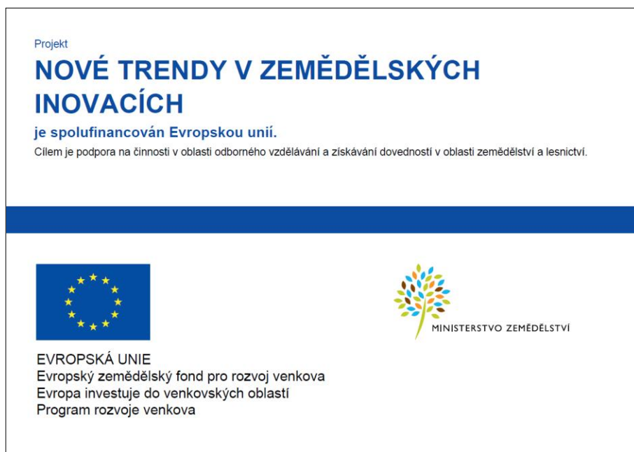
Obrázek č. 2: Praktická ukázka vzhledu plakátu A3 nebo informační desky (varianta na šířku a varianta na výšku u operace 1.1.1)